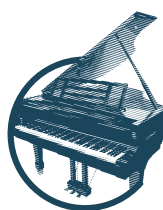
Órgano | Piano

Estudio analítico Se estudiarán las preferencias musicales y las características del cliente con el objetivo de diseñar un servicio adaptado y personalizado.