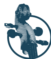
Violín | Viola