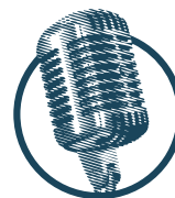
Soprano | Tenor